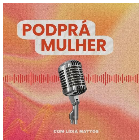
Figura 1 – Logo do Podcast